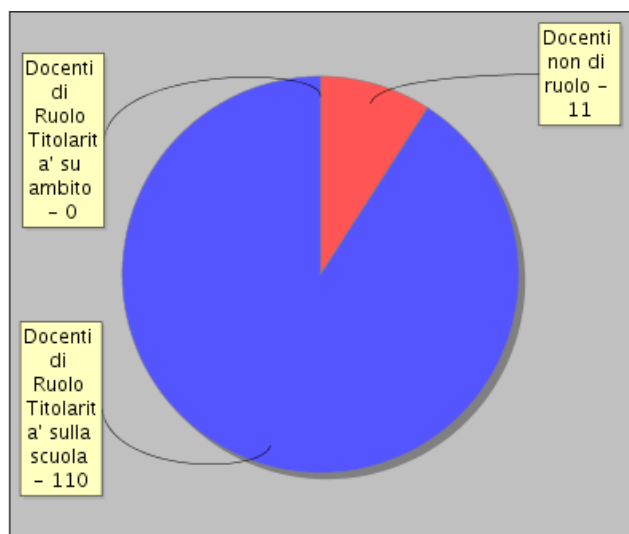
Distribuzione dei docenti per tipologia di contratto